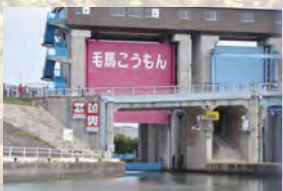
けまこうもん 毛馬閘門