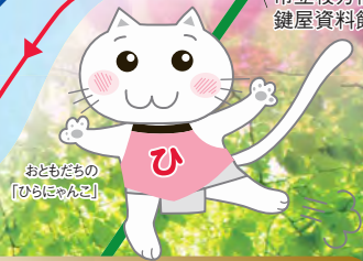
おともだちの「ひらおんこ」