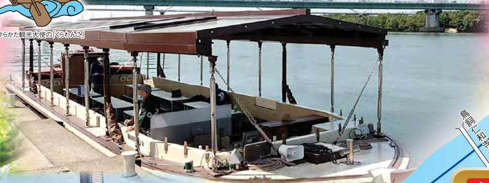
屋形船風遊覧船「えびす」