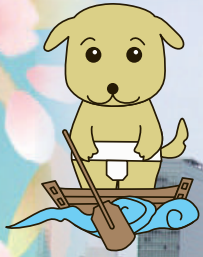
ひらかた観光大使の「くわんこ」