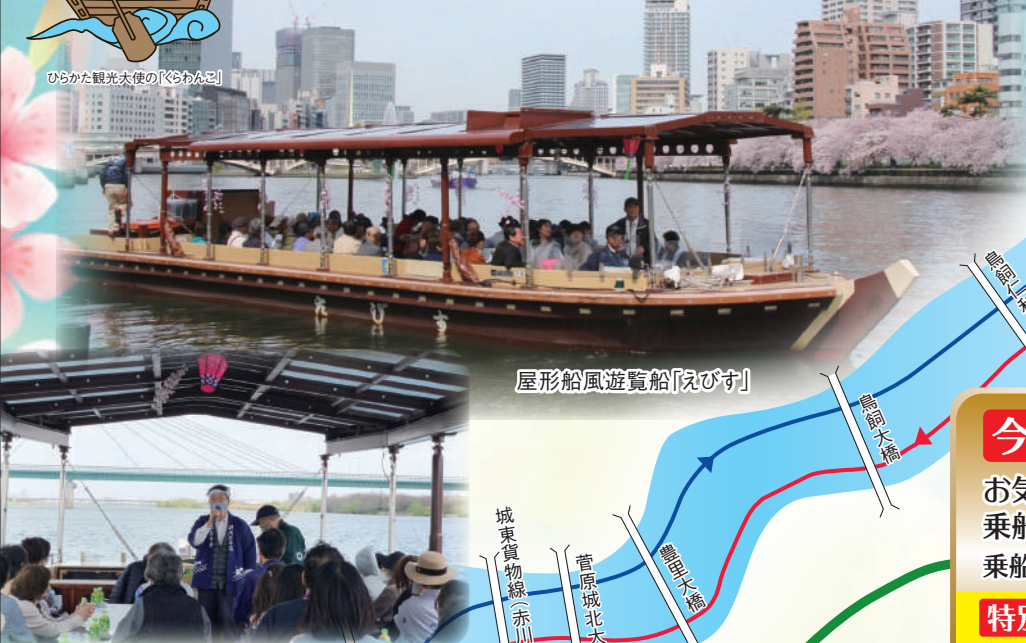
屋形船風遊覧船「えびす」

淀川の歴史についての解説や「三十石船舟唄」を聞きながら、当時の舟運に思いをはせ、季節感あふれる船旅をお楽しみください。