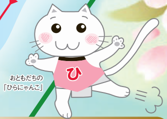
おともだちの「ひらにゃんこ」